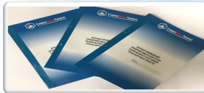
Внесение записи в журнал предрейсового технического контроля