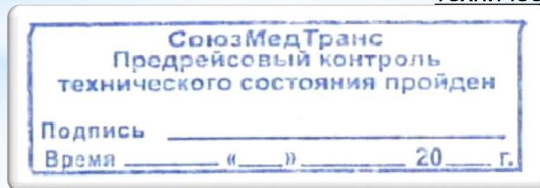
Отметка в путевом листе