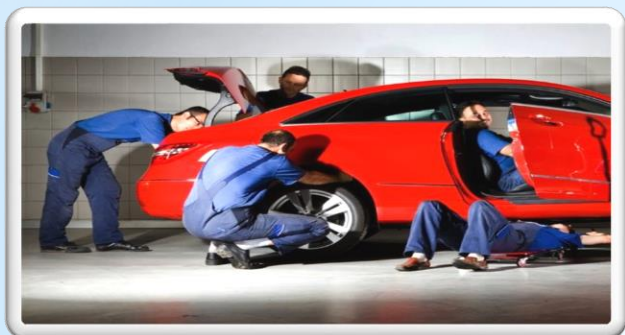
Осмотр транспортного средства