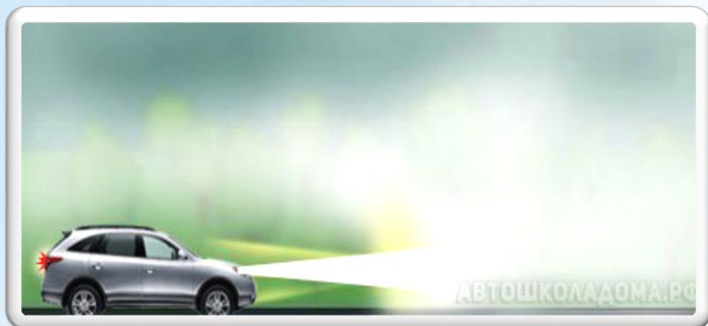
Проверка внешних световых приборов