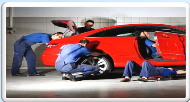
Осмотр транспортного средства