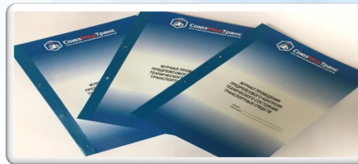
Внесение записи в журнал предрейсового технического контроля