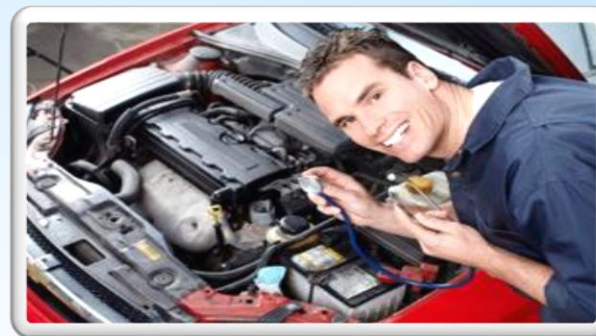
Проверка двигателя и Рулевого управления